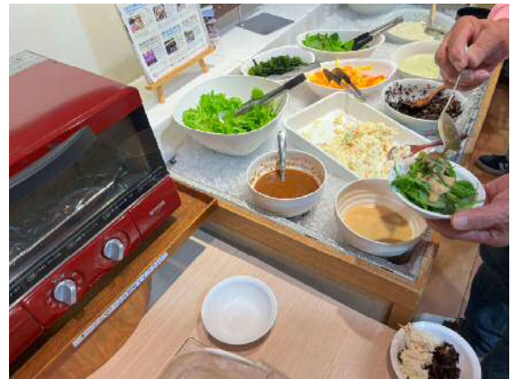
【店内とバイキングの様子】