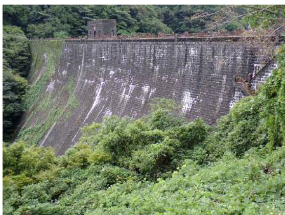
【堤体下流面の様子】