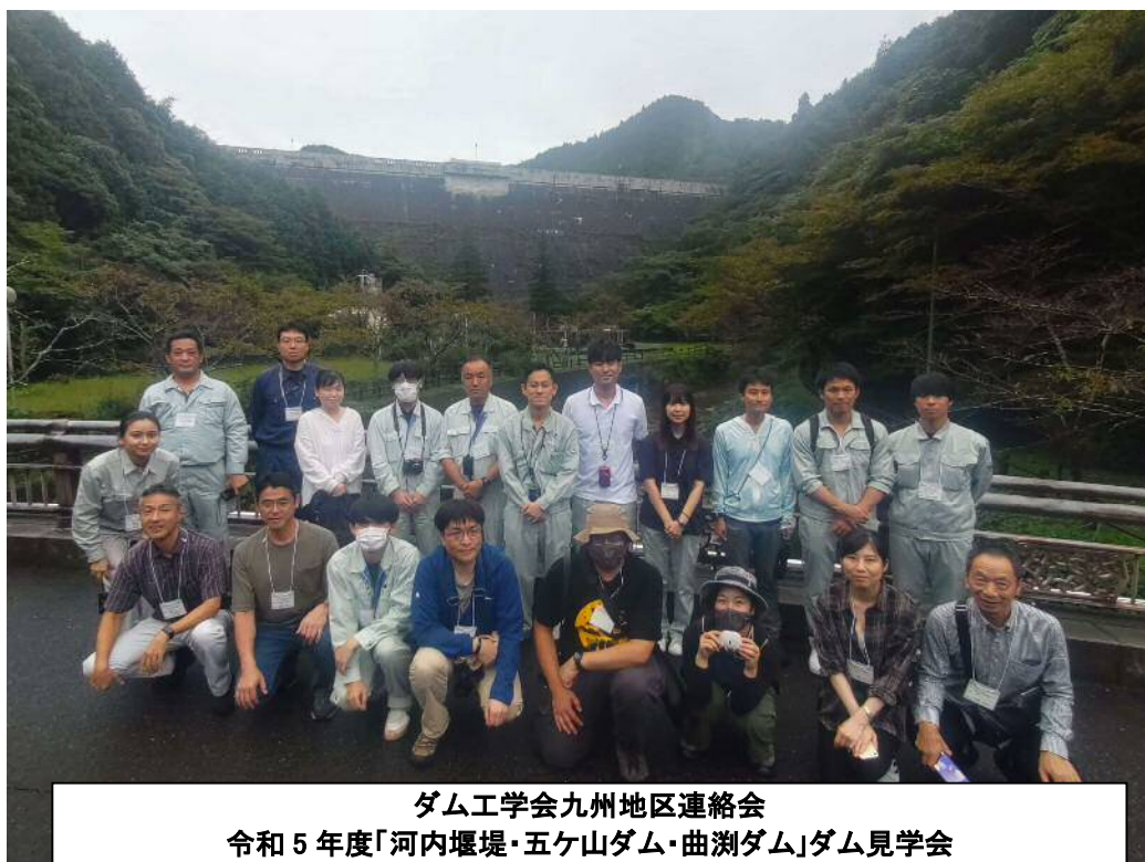
ダム工学会九州地区連絡会 令和5年度「河内堰堤・五ヶ山ダム・曲淵ダム」ダム見学会

ダム見学会に参加頂いた方々、ご協力頂きました五ヶ山ダム管理所の方々、福岡市水道局様、その他関係者各位には厚く御礼申し上げます。