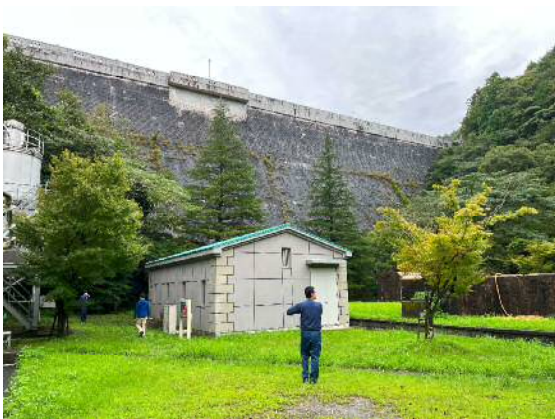
【ダム下流側からの様子】