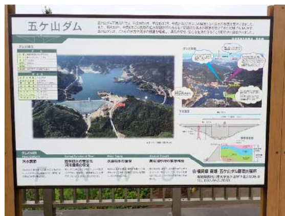
【五ヶ山ダム案内板】