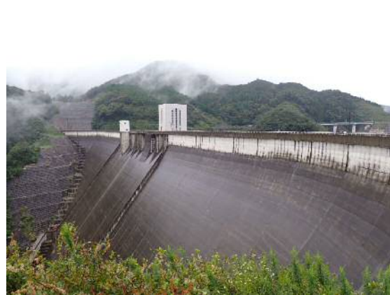
【ダム左岸側からの様子】