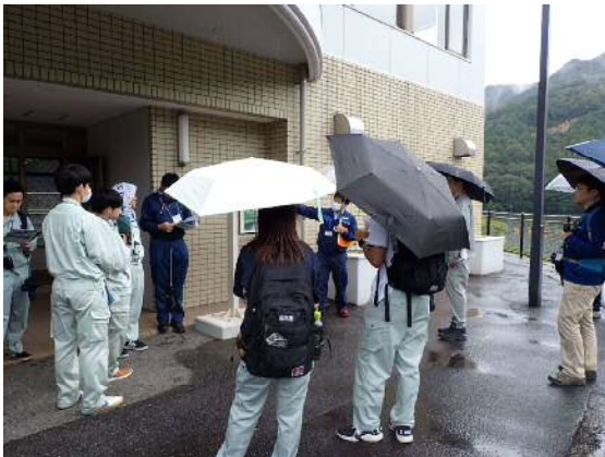
【曲漕ダム概要説明】

その後、下流側にある曲漕ダムパークまでバスで移動し、下流側からダムの見学を行いました。下流堤体面では 1934（昭和 9）年の人口増加等による水需要増加に伴う拡張工事により嵩上げた跡が見られ、福岡市の水の歴史が感じられました。また、通常ダム見学では、開放していない監査廊（新旧）にも、今回は特別に場長のご厚意で見学させていただきました。