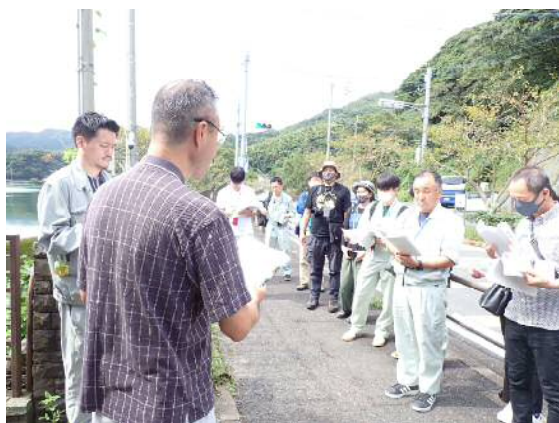
【河内堰堤の概要説明】

その後、重要文化財である南河内橋までバスで移動し、河内貯水池に架かる現存唯一のレンズトラス橋の構造を眺めながら歩いて渡りました。