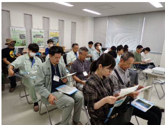
【五ヶ山ダム概要説明】

昼食後、五ヶ山ダム管理所へ移動しました。五ヶ山ダム管理所の方より五ヶ山ダムの概要説明をしていただき、五ヶ山ダムの建設に関する動画を鑑賞しました。巡行 RCD 工法による急速施工により、100m 級の堤体を 2 年弱で打設完了させた工事は圧巻でした。その後、管理所内の操作室を見学させていただきました。一般ではなかなかお目にかかれないダムコン、機側操作盤および制御装置類の説明をしていただきました。