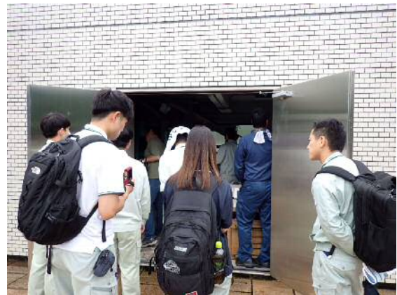
【取水設備の開閉装置室の見学】